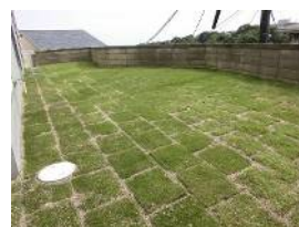
芝をひいた南西庭