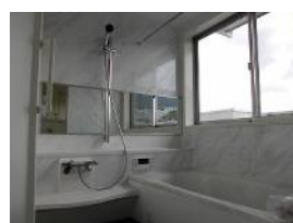
明るくゆったりした浴室