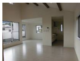
床暖房完備のリビングダイニング