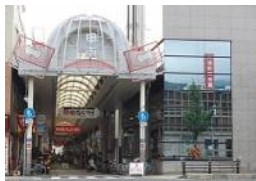
コープリビング甲南